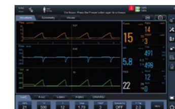
Интерфейс измерения формы волны