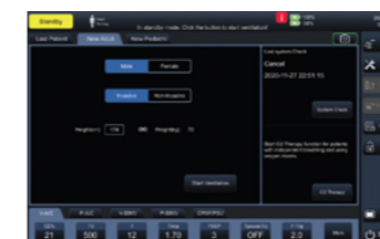
Интерфейс данных пациента

Технология IntelliSynTec: автоматически регулирует оптимальные значения [триггера выдоха] в зависимости от характеристик легких пациента, что делает дыхание более комфортным и убирает необходимость часто корректировать настройки аппарата во время лечения. Это эффективно снижает нагрузку на медработников и обеспечивает отличную синхронизацию.