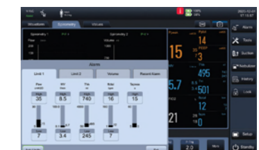
Предел автоматического сигнала тревоги

Благодаря интуитивно понятному дизайну пользовательского интерфейса V3, для настройки параметров вентиляции требуется всего два шага. Функциональная схема испытана клинически, вы получите то, что необходимо.