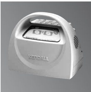
Patientenindividueller Kompressionszyklus für optimalen Schutz vor Thrombo-Embolien