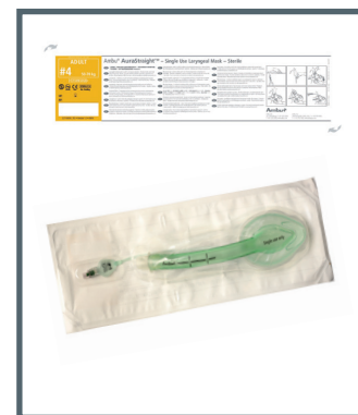
AuraStraight в пакете с цветовым кодом и инструкцией по применению