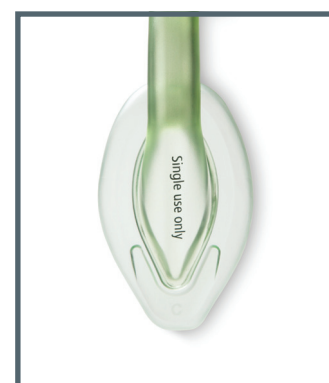
AuraStraight с усиленным наконечником