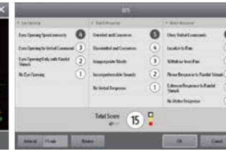
Шкала комы Глазго