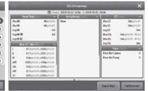
Отчет ЭКГ за 24 часа