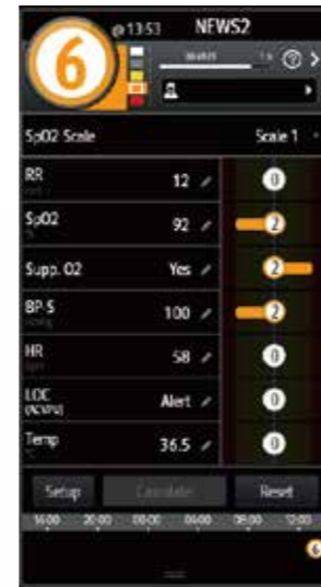
Панель EWS на мониторах ePM