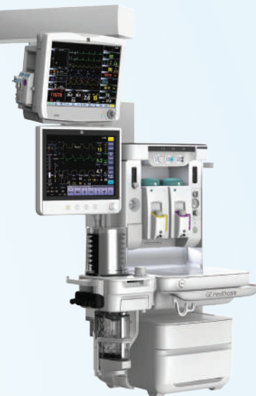
Подвесная система (Carestation 650c)